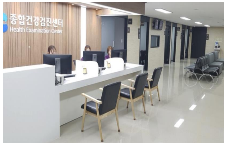
김해복음병원 이용 고객 인공지능 질병예측 솔루션 "셀비 체크업" 서비스 제공